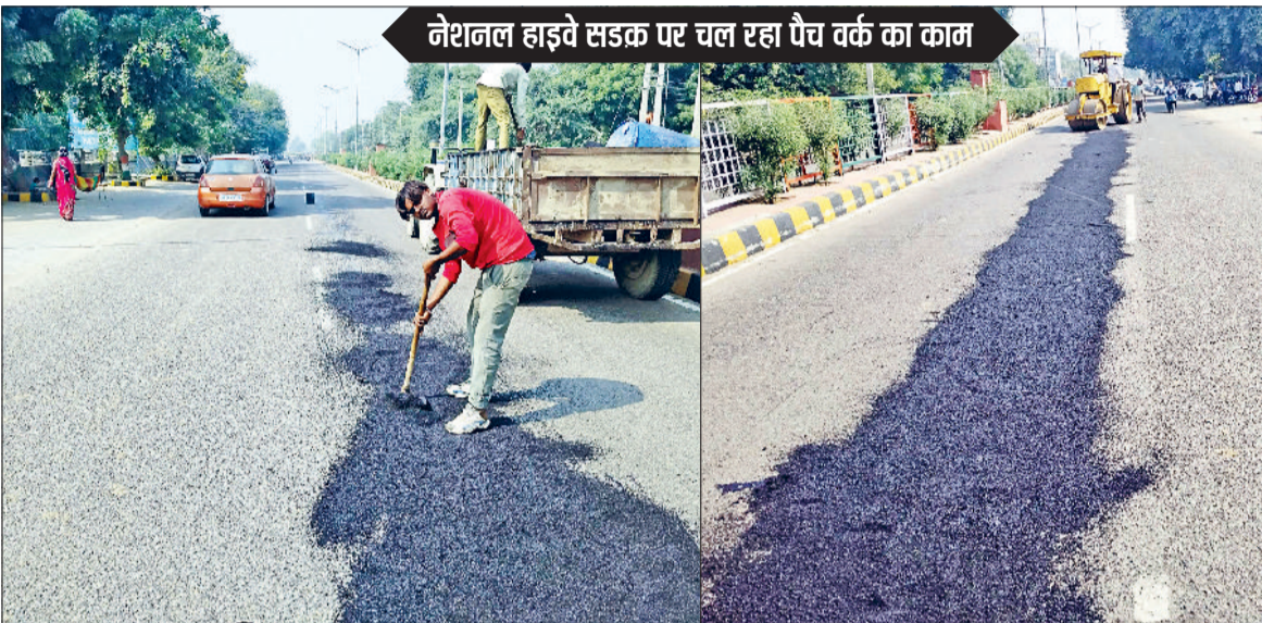
नेशनल हाइवे सड़क पर चल रहा पैच वर्क का काम