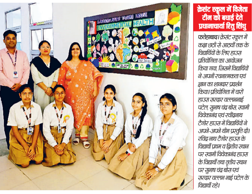
फतेहाबाद। क्रेसंट स्कूल में कक्षा छठी से आठवीं तक के विद्यार्थियों के लिए हाउस प्रतियोगिता का आयोजन किया गया, जिसमें विद्यार्थियों ने अपनी रचनात्मकता एवं ज्ञान का शानदार प्रदर्शन किया। प्रतियोगिता में चारों हाउस सरदार वल्लभभाई पटेल, सुभाष चंद्र बोस, स्वामी विवेकानंद एवं रवींद्रनाथ टैगोर हाउस में विद्यार्थियों ने अपने-अपने शौच प्रस्तुति दी। रविंद्र नाथ टैगोर हाउस के विद्यार्थी प्रथम व द्वितीय स्थान पर स्वामी विवेकानंद हाउस के विद्यार्थी तृतीय स्थान पर सुभाष चंद्र बोस एवं सरदार वल्लभभाई पटेल के विद्यार्थी रहे।