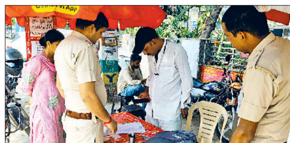
फतेहाबाद। अस्थायी सिम विक्रेताओं को हटाने पुलिस कर्मचारी।