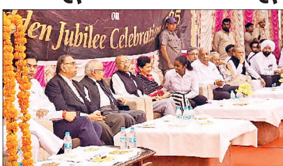
सिरसा। बार में आयोजित कार्यक्रम में मौजूद सांसद कुमारी सैलजा।

सरकार हांजी-हांजी कहने में लगी हुई है। साथ ही सैलजा ने दावा किया कि बिहार की जनता बदलाव चाहती है और इस बार महागठबंधन की सरकार बनेगी। सांसद कुमारी सैलजा सोमवार को सिरसा जिला बार एसोसिएशन की ओर से आयोजित गोल्डन जुबली वर्ष