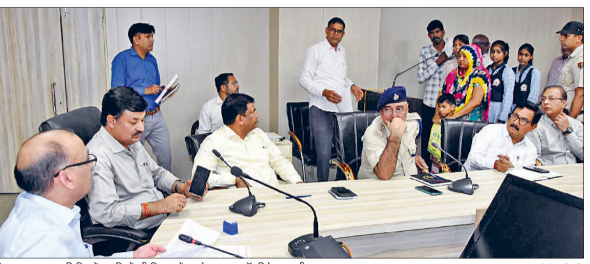
फतेहाबाद। समाधान शिविर में नागरिकों की शिकायतें सुनते उपायुक्त डॉ. विवेक भारती।