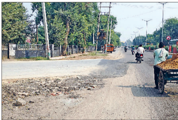
फतेहाबाद। रतिया मोड़ पर टूटी सड़क।