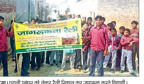
सिरसा। पराली प्रबंधन को लेकर रैली निकाल कर जागरूक करते विद्यार्थी।

शक्ति घटने व प्रदूषण की वजह से होने वाली परेशानियों को लेकर किसानों को जागरूक किया जा रहा है। इसी क्रम में सोमवार को ठोबरियां, मोडियाखड़ा, मिठनपुरा, बुर्जकमगढ़, रोड़ी, पिनहारी, गंगा, देसूमलकाना, अभीली, रत्ताखड़ा, गिंदडखड़ा, सक्ताखड़ा, सुखेराखड़ा, मल्लेवाला, अबूतगढ़, मल्लेकां, अलीकां व जीवननगर आदि गांवों में स्कूली विद्यार्थियों व विभाग की टीमों ने ग्रामीणों को पराली न