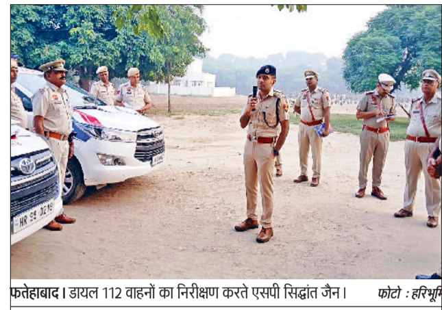
फतेहाबाद। डायल 112 वाहनों का निरीक्षण करते एसपी सिद्धांत जैन।